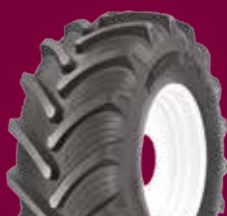
TAURUS POINT HP

REMBOURSÉS SUR VOTRE ÉQUIPEMENT COMPLET DE 4 PNEUMATIQUES