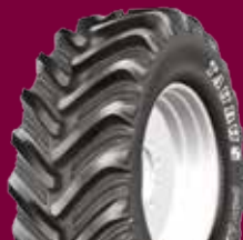
TAURUS POINT 65