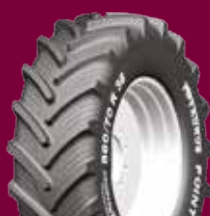
TAURUS POINT 70