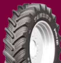
TAURUS POINT 8